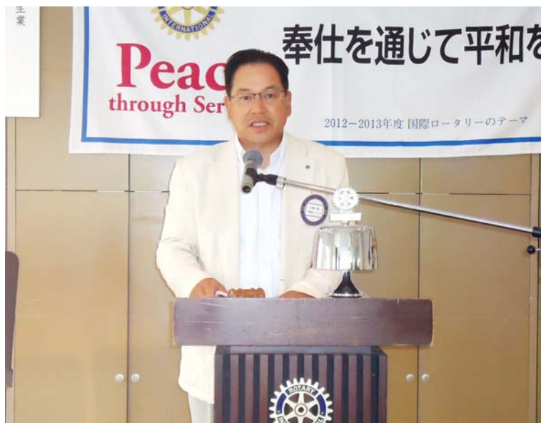
山崎会員卓話風景